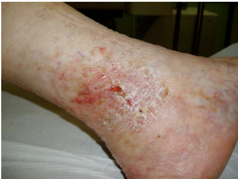
Foto 8. Guarigione dopo 30 giorni. Photo 8. Healing after 30 days.