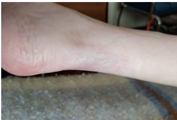
Foto 18. Donna 73 aa con ulcera diabetica da circa 6 mesi. Photo 18. 73 year old woman with diabetic ulcer for about 6 months.