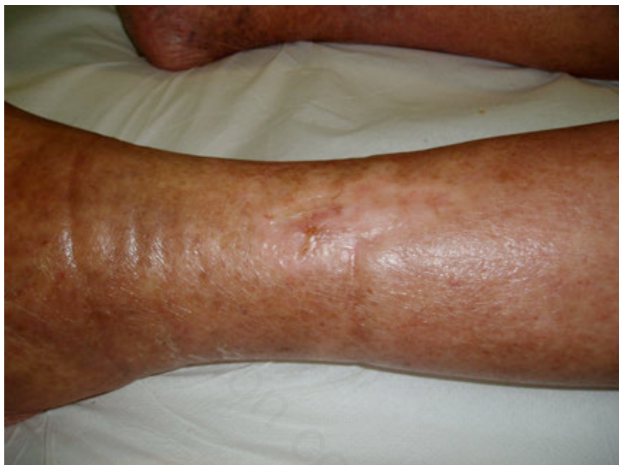
Foto 12. Donna 90 aa con ulcera arteriosa da circa 1 anno. Photo 12. 90 year old woman with arterial ulcer for about 1 year.