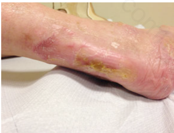
Photo 16. Healing after 12 months and 4 cycles.

Foto 16. Guarigione dopo 12 mesi e 4 cicli.