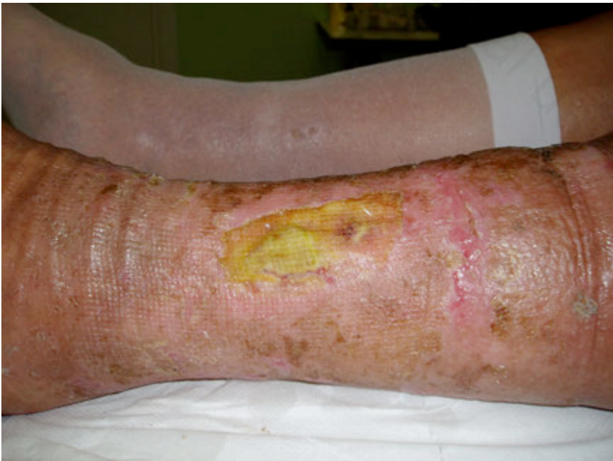
Photo 10. Homologous skin graft after the 3rd treatment.

Foto 10. Innesto cute omologa dopo il 3° trattamento.